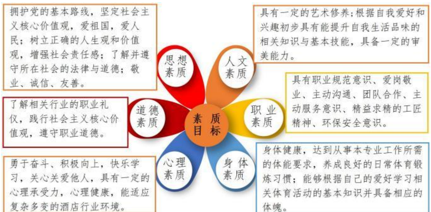
图 1 素质目标示意图