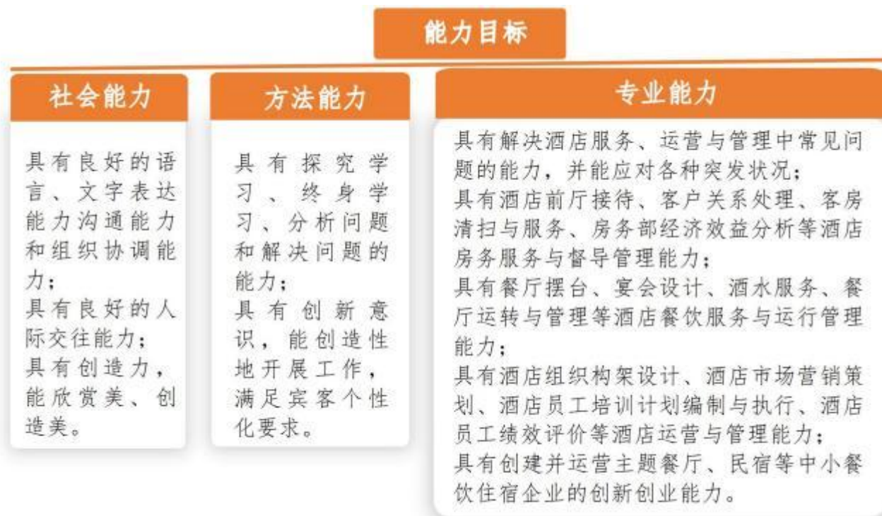
图 3 能力目标示意图