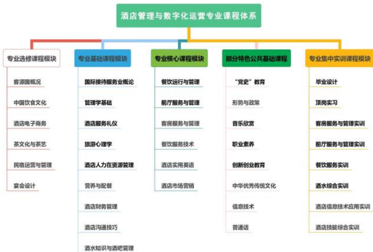
图 4 专业课程体系

本专业课程分为五大模块：公共基础课程模块（必修、选修）、专业基础课程模块、专业核心课程模块、专业选修课程模块、专业集中实训模块，共 46 门课，3208 学时，187 学分。专业课程对接国家酒店管理与数字化运营行业标准，融入相关技术等级证书内容。持续深化“三全育人”综合改革，把立德树人融入思想道德教育、文化知识教育、技术技能培养、社会实践教育各环节，推动课程思想政治工作体系贯穿教学体系、教材体系、管理体系，切实提升思想政治工作质量。结合高星级酒店业前厅、客房、餐饮、大堂吧、酒吧一线服务员和管理者职业道德与素养，融入课程思政元素，贯穿于专业课程教学全过程，具体课程结构如图4 所示。